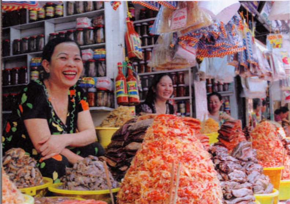
Chaos nonstop: Auf den Straßen von Saigon regieren die Mopedfahrer. – Luxuriöser Aussichtspunkt: Die „Tonle Pandaw“ ist im alten Kolonialstil gebaut, das Sonnendeck ganz aus Holz. – Markt im vietnamesischen Chau Doc: Wer die Landessprache nicht beherrscht, versucht es beim Einkaufen mit Zeichensprache