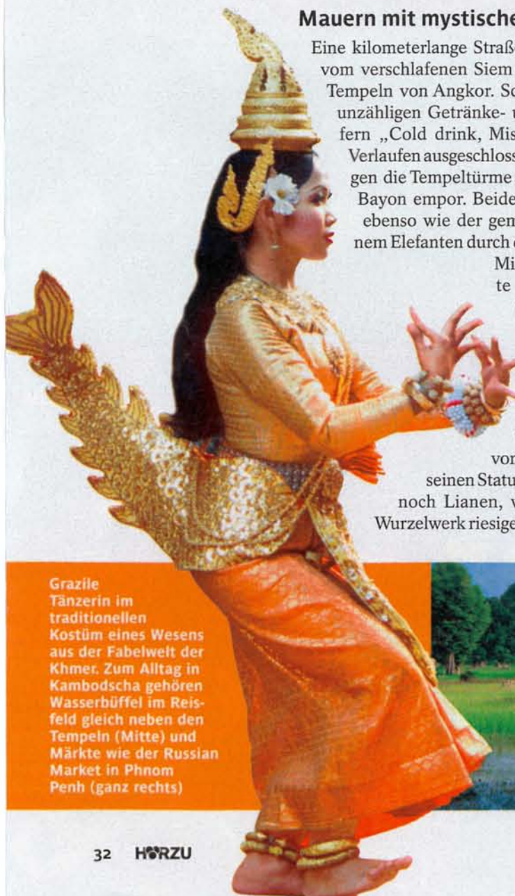
Grazile Tänzerin im traditionellen Kostüm eines Wesens aus der Fabelwelt der Khmer. Zum Alltag in Kambodscha gehören Wasserbüffel im Reisfeld gleich neben den Tempeln (Mitte) und Märkte wie der Russian Market in Phnom Penh (ganz rechts)