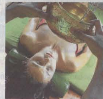
Ayurveda in Sri Lanka

RAJASTAN Es ist das Land der Könige und ihrer prachtvollen Paläste im Nordwesten Indiens. Märchenschlösser aus 1001 Nacht sind auch die Taj-Hotels, in denen die Urlauber auf einer zehntägigen Rundreise durch Rajasthan wohnen, oder besser gesagt residieren. Mit Lufthansa-Flug nach Delhi, Inlandsflug, Ü/F und Ausflugsprogramm kostet die Luxusreise derzeit ab 2744 Euro.