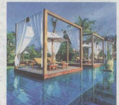
Luxushotels in Thailand

Sehnsuchtsziel aller Asien-Reisenden ist Bali, die indonesische Götterinsel, die zwischen Java und Lombok im Indischen Ozean liegt. Sehnsuchtsziel vor allem deshalb, weil Bali weit ist und ein Zwischenstopp auf der 16-stündigen Hinreise eigentlich unvermeidlich. Ideal ist die Kombination eines Badeurlaubs auf Bali deshalb mit einem Städtetrip. Zum Beispiel mit Hongkong: Eine 13-tägige Reise mit drei Tagen Aufenthalt in der Megacity an der Südküste Chinas (inklusive Übernachtung im Eaton Hotel und der Hongkong-Island-Tour) und anschließendem Badeurlaub in der Diwankara Holiday Villa am schönen Sandstrand von Sanur auf Bali kostet derzeit ab 1077 Euro pro Person inklusive der Flüge mit Cathay Pacific. Gültig vom 1. Mai bis 15. Juni 2009.