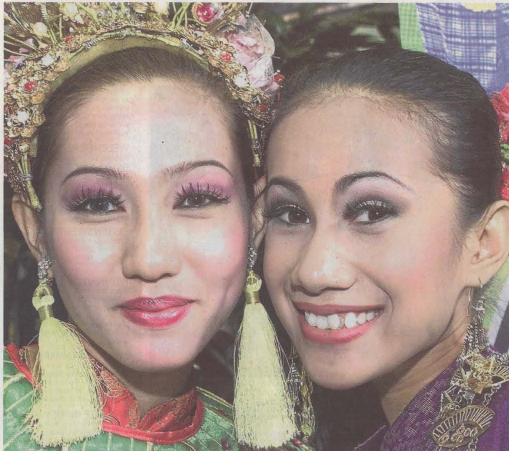
Ein Lächeln, das verzaubert: Auch wegen ihrer gastfreundlichen Menschen sind die asiatischen Länder wahre Urlaubsparadiese