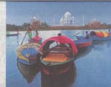
Paläste in Indien

INDIEN Kerala Ayurveda-Anwendungen kann man heute schon in beinahe jedem Wellnesshotel buchen. Die wahre Lehre über das Wissen vom Leben, so die wörtliche Übersetzung, aber kommt aus Indien. Im mehrfach ausgezeichneten Somatheeram Ayurvedic Health Resort in Chowara an der Südwestküste Indiens kann man eine 14-tägige Ayurveda-Reinigungs- und Vitalisierungskur jetzt schon ab 990 Euro buchen. Übernachtung, Vollpension und das gesamte ayurvedische Programm inklusive Flüge mit Emirates ab München nach Trivandrum ab 565 Euro.