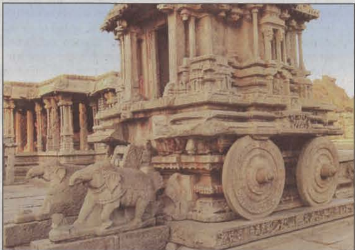
Mächtig: der Goldene Streitwagen in der Ruinenstadt Hampi.

welt. Es gibt zwei Restaurants, eine Bar, ein Spa, einen Fitnessraum und ein Business-Center mit Internetanschluss. Die Kabinen sind holzgetäfelt, jeden Abend wird das Bett akkurat aufgeschlagen, davor stehen weiße Frotteeschlappchen. Wer vom Ruckeln des Zugs und dem Surren der Klimaanlage nicht sanft in den Schlaf geschaukelt wird, kann sich von Bollywood-Dramen auf Flachbildschirm unterhalten lassen.