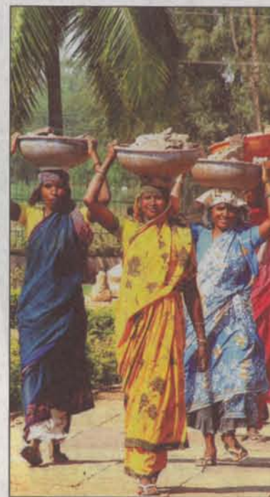
Kunterbunt: Indische Frauen tragen in ihren leuchtenden Saris Wäsche zum Fluss.

Später werden die Erinnerungen an all die Tempel und Paläste verwischen. Da war der mit unzähligen Kuppeln, Bögen und Türmchen verzierte Stadtpalast des Maharadschas