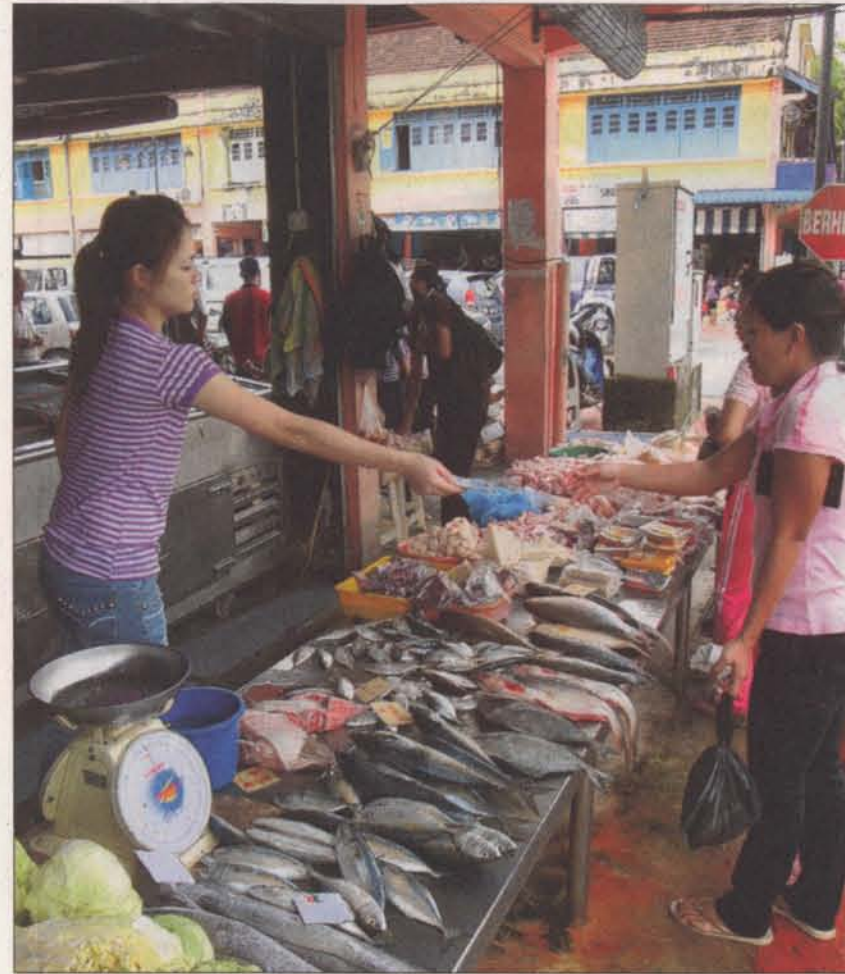
Allerorts, wie hier in Kanowit, ist Frischfisch aus dem Fluss im täglichen Angebot.