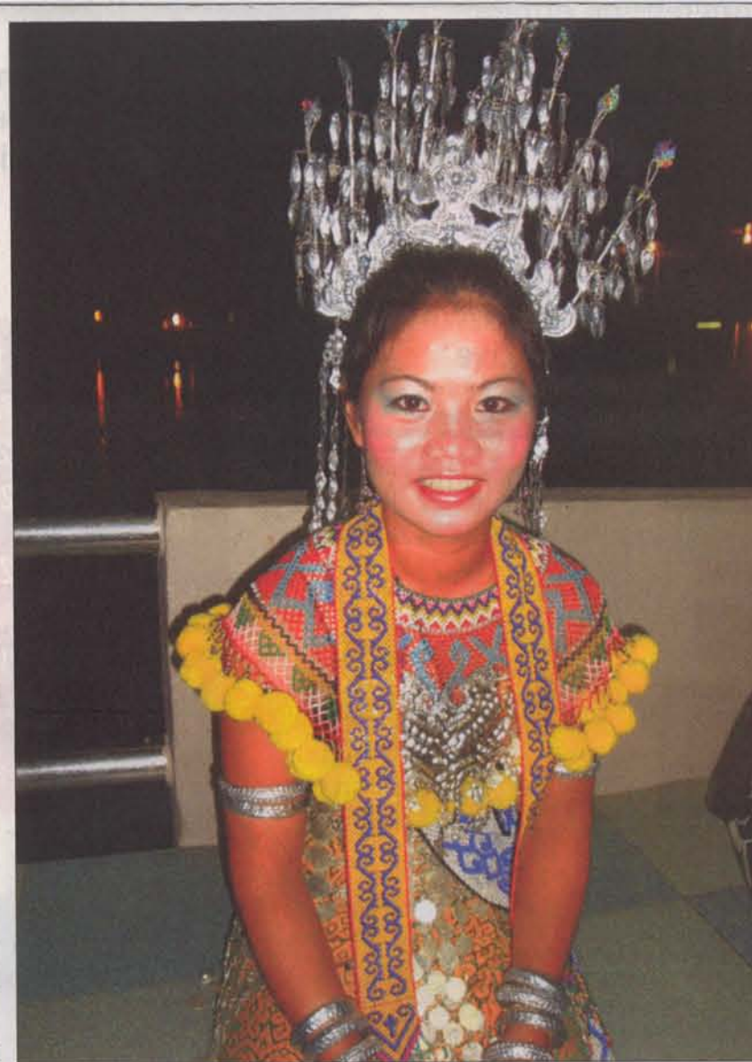
Ein Iban-Mädchen in traditioneller Tracht vor dem Folklore-Auftritt.

Am dritten Kreuzfahrt-Tag erreicht die „Orient Pandaw“ den 13.000 Seelen-Ort Kapit – Verwaltungssitz und Endpunkt der Zivilisation am Rande des Regenwaldes. Erschlossen wurde er einst vom Engländer James Brooke, dem selbsternannten „Weißen Raja von