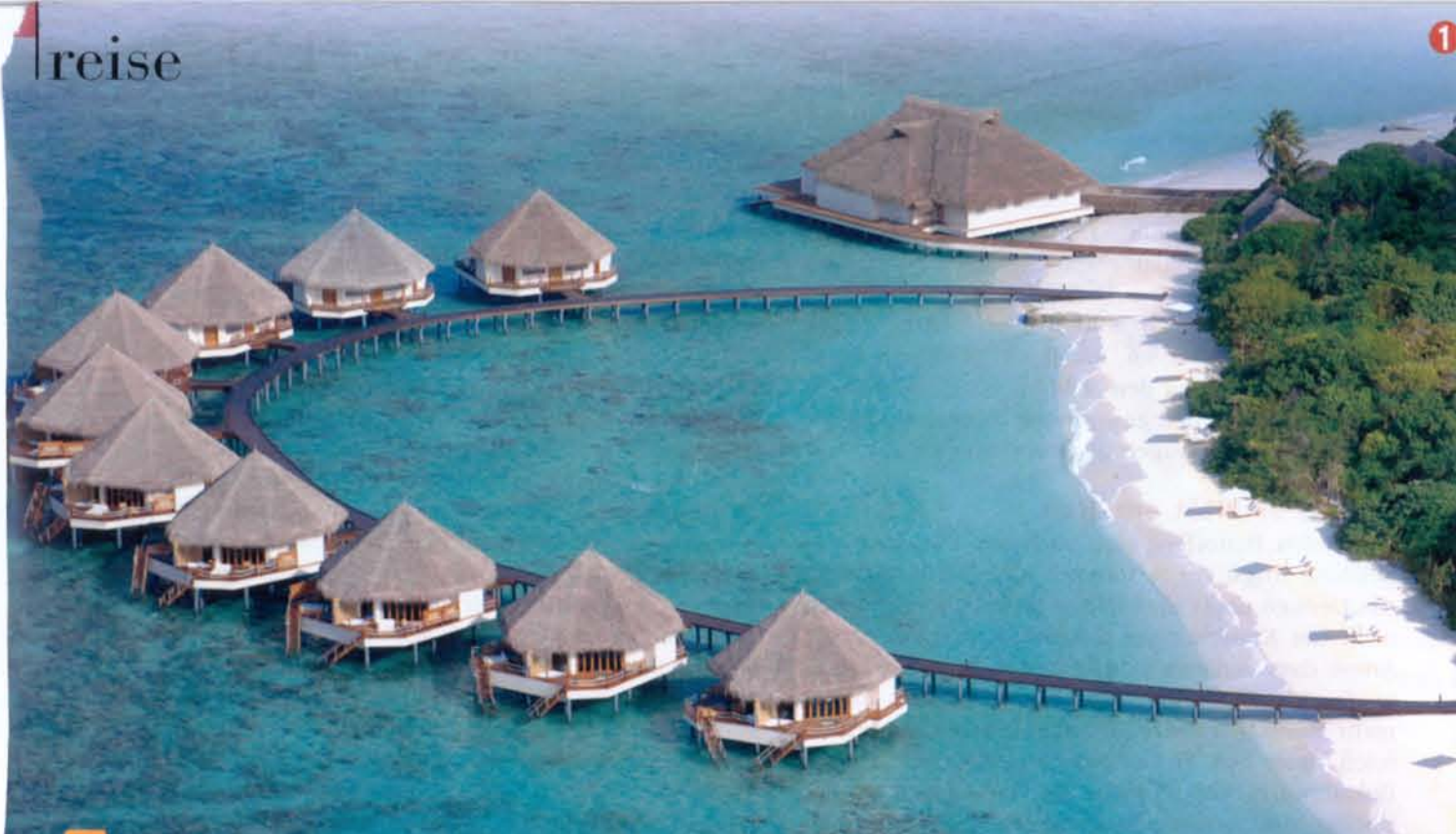
1+2 The Water Villas 3 Ananda Abhayanga 4 Ananda Palace 5 Abhayanga Massage 6 Infinity Pool 7 Kalari 8 Shanti Ananda

Ayurveda gilt als älteste Gesundheitslehre der Welt und bedeutet übersetzt „Das Wissen vom langen Leben“. Die ganzheitliche Heilmethode hat zum Ziel, Körper, Geist und Seele, die aufgrund von psychischem und physischem Stress aus dem Gleichgewicht gekommen sind, wieder in Einklang zu bringen.