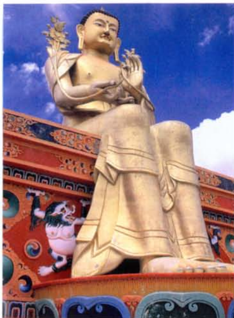
Die riesige Maitreya Buddha-Statue vor dem Kloster Likir. Maitreya gilt als der Buddha der Zukunft und der große kommende Weltlehrer

Einsatz auf dem höchstgelegenen Golfplatz der Welt – nur Soldaten dürfen hier golfen – ist nicht gerade imagefördernd. Alternativ bringen sie mit ihren Armeefahrzeugen die Kinder in die Schule nach Leh und holen sie am Nachmittag wieder ab. In den Oasen des Nubratals blühen im Frühjahr die Aprikosenbäume. Doch an diesem Tag wirbelt der Wind den Sand der Dünen durchs Tal wie ein Handmixer das Mehl durch die Schüssel. Einheimische Frauen würden jetzt einfach ihre