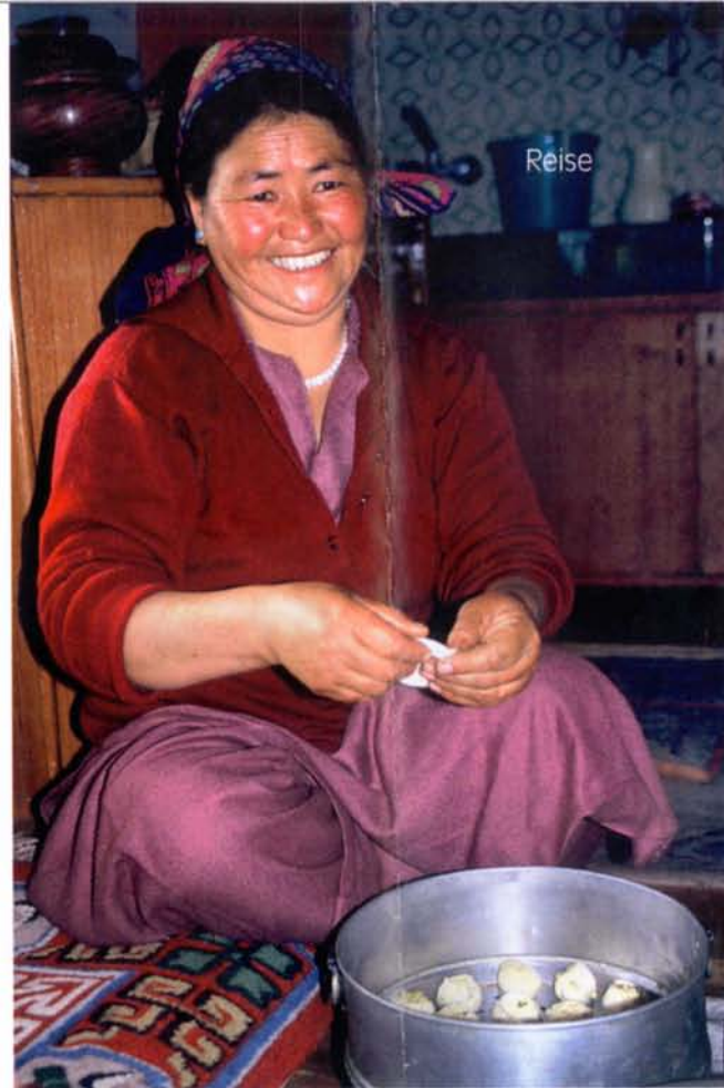
Die Gastgeberin beim Zubereiten von Momos – den typisch indischen und mit Gemüse gefüllten Teigtaschen

Was fehlt noch? Der Indus! Ja, sein smaragdgrünes Wasser fließt durchs trockene Tal bis nach Pakistan. Zur Schneeschmelze im Frühjahr schwillt er gehörig an, sodass die Bauern ihre Kartoffel-, Bohnen- und Senfsaat endlich bewässern können. An seinen Ufern wachsen Pappeln und Weiden, deren Blätter besonders in der Abendsonne silbrig glänzen. Auf der anderen Seite des Flusses, an der Straße nach