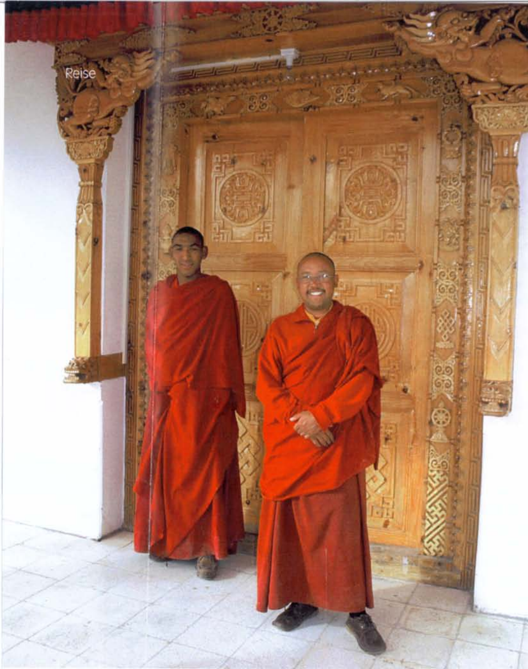
In ihren roten Roben stehen die Mönche vor dem Kloster in Samstanling. Neben dem Buddhismus ist auch der Islam stark vertreten

Manali, drängen sich Pashmina-Ziegen im Gehege der staatlichen Zuchtfirma und meckern aus voller Kehle. Aus ihrem Bauchfell wird die weltweit begehrte Kaschmirwolle gewonnen.