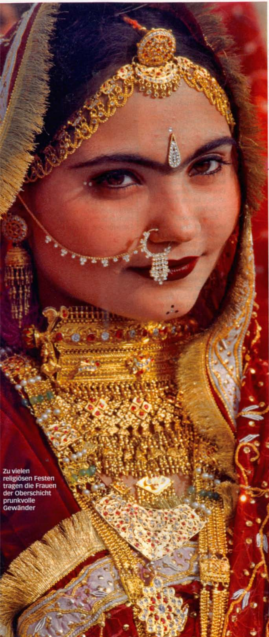
Zu vielen religiösen Festen tragen die Frauen der Oberschicht prunkvolle Gewänder