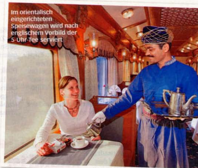
Im orientalisches eingerichteten Speisewagen wird nach englischem Vorbild der 5-Uhr-Tea serviert